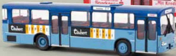
50707 MB O 305 „Täubert“/Gießen, TD 31,90 €