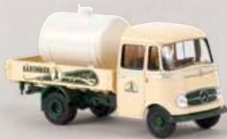
13560 MB L319 „Bärenbier“ 17,90 €