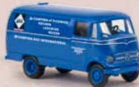
v 36025 MB L 319 „Camping Gaz“ 12,90 €