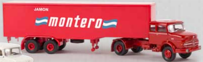
v 81113 MB LS 1620 „Jamon Montero“ 29,90 €

Wegen der großen Nachfrage schon jetzt neue Farben beim Jeep Gladiator!