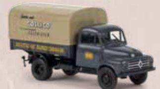
v 38027 Borgward B 1500 „Collico“ der DB 13,90 €