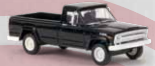
v 19807 Jeep Gladiator B (1967) schwarz, TD 19,90 €