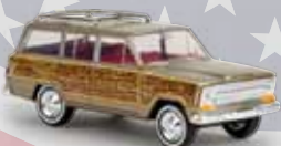
19856 Jeep Wagoneer „Woody“ gold-met., TD 21,90 €