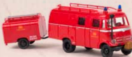
v 36608 MB LF 319 LF 8 TSA-Anhänger, Bahnfeuerwehr 23,90 €