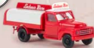
v 37128 Hanomag L 28 „Lindener Biere“ 14,90 €