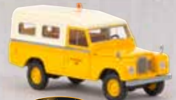
Starmada v 13779 Land Rover 109 „British Rail“ 20,90 €