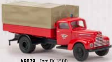
49029 Ford FK 3500 BF Köln 16,90 €