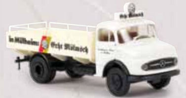
47030 MB L 322 „Mölsch Bier“ 15,90 €