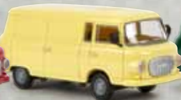
30112 Barkas B1000 Kasten pastellgelb, TD 12,90 €