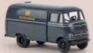
v 36030 MB L 319 „Rollfuhrdienst“ der DB 13,90 €