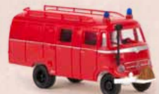
v 36609 MB LF 319 LF 8 rot/weiß 16,90 €