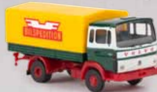
v 34755 Volvo F613 „Bilspedition“ 21,90 €