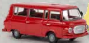
30037 Barkas B1000 Bus karminrot, TD 12,90 €