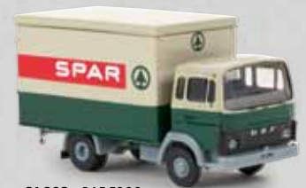
v 34803 DAF F900 „Spar“ 21,90 €