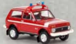
27217 Lada Niva „Feuerwehr“, TD 14,90 €