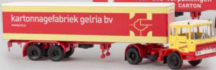
85265 DAF FT2600 „van Reenen“ 24,90 € 85266 DAF FT2600 „van Reenen/Gelria“, klassische Version“ 24,90 € 85267 DAF FT2600 „van Reenen/Gelria“, moderne Version“ 24,90 €