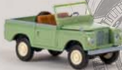
n 13850 Land Rover 88 blassgrün 19,90 €

Der Land Rover 109 von Starmada bekommt einen kleinen Bruder: Ab Ende Oktober wird der Land Rover 88 (ab 1968) von Starmada ausgeliefert. Die Zahl 88 steht für einen Radstand von 88 inches (2,24m).