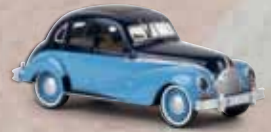
v 27316 EMW 340 stahlblau/pastellblau, TD 13,90 €