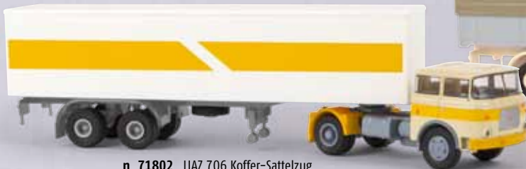
n 71802 LIAZ 706 Koffer-Sattelzug elfenbein/gelb 28,90 €