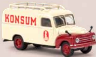
v 58163 Hanomag L 28 Kasten „Konsum“ Starline 25,90 €