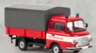
30309 Barkas B 1000 PP „Feuerwehr“, TD 15,90 €