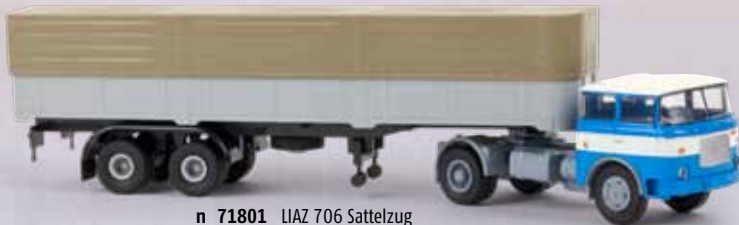
n 71801 LIAZ 706 Sattelzug blau/grau 27,90 €

Bereits 1957 stellte Skoda mit dem 706 RT einen modernen Frontlenker vor, der bis 1987 optisch nahezu unverändert gebaut wurde. Nachdem die DDR die Fertigung von Schwerlastwagen einstellen musste, wurden die schweren Skoda vom sozialistischen Bruder bezogen und beherrschten bald das Straßenbild.