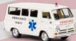
v 34323 Dodge A 100 Bus „Tampa Ambulance“, TD 19,90 €