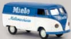
v 32050 VW Kasten T1a „Miele Melkmaschinen“ 12,90 €