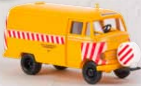
v 36031 MB L 319 Weichenreinigung/ Bogestra 23,90 €