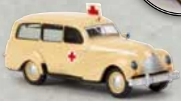
n 27353 EMW 340 Kombi „Krankenwagen“, TD 15,90 €