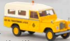
Starmada v 13780 Land Rover 109 „ANWB“ 21,90 €