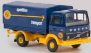
v 34754 Volvo F613 „ASG“ 21,90 €