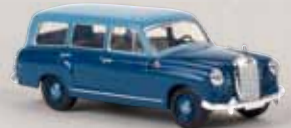
v 13465 MB 180 Kombi hellblau/dunkelblau 14,90 €