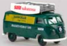
v 32691 VW Kasten T1b „Hankkija“ 16,90 €