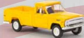
v 19805 Jeep Gladiator B (1967) gelb, TD 19,90 €