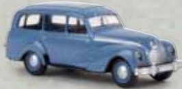
v 27354 EMW 340 Kombi taubenblau, TD 12,90 €