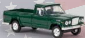
v 19803 Jeep Gladiator A (1962) moosgrün, TD 19,90 €