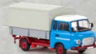
30306 Barkas B 1000 PP „LPG Roter Oktober“, TD 14,90 €