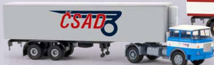
n 71804 LIAZ 706 Kühlkoffer-Sattelzug „CSAD“ 29,90 €