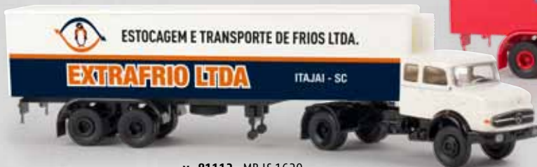
v 81112 MB LS 1620 „Extrafrio“ 29,90 €