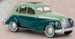
v 27315 EMW 340 blassgrün/blaugrün, TD 13,90 €