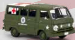
v 34322 Dodge A 100 Bus „US Army medical Service“, TD 19,90 €