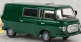
30220 Barkas B1000 Halbbus moosgrün, TD 12,90 €