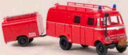
v 36607 MB LF 319 LF 8 TSA-Anhänger, rot/schwarz 21,90 €