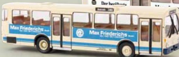
50734 MB O 305 „Friederichs“/Mönchengladbach, TD 35,90 €