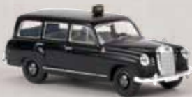
v 13463 MB 180 Kombi „Taxi“ 14,90 €