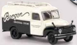
v 58161 Hanomag L 28 Kasten „Borgon“ 24,90 €