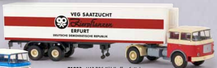
n 71803 LIAZ 706 Kühlkoffer-Sattelzug „VEG Saatzucht“ 29,90 €