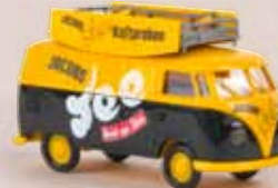
v 32692 VW Kasten T1b „Jacobs Tee“ 15,90 €