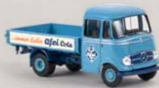
13559 MB L319 „Afri-Cola“ 16,90 €