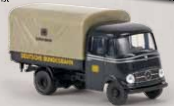
13568 MB L319 „DB Rollfuhrdienst“ 19,90 €