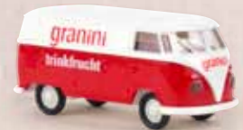
v 32688 VW Kasten T1b „Granini“ 11,90 €