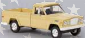
v 19802 Jeep Gladiator A (1962) elfenbein, TD 19,90 €

Wegen der großen Nachfrage schon jetzt neue Farben beim Jeep Gladiator!