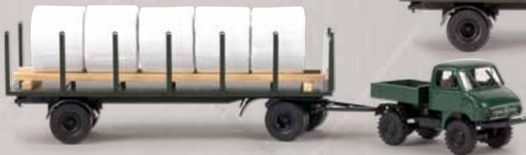
v 39114 Unimog 411 mit Anhänger und Heuballen 23,90 € 39156 Unimog 402 mit Anhänger und Schwartenbunde 23,90 €